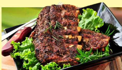
Costelinha de Porco de forno