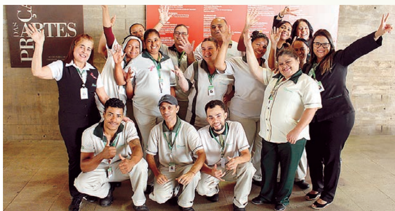
Colaboradores que atendem a Praça das Artes