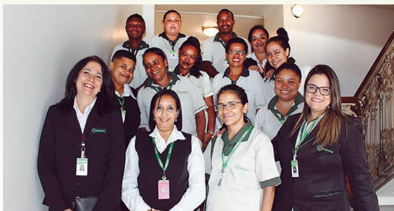
Equipe que atua no Theatro Municipal