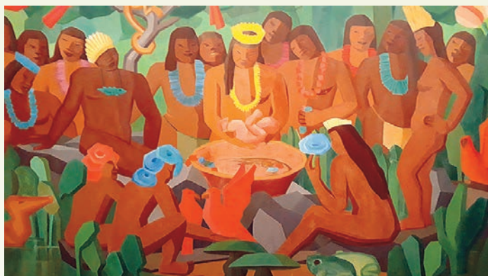
Obra original de Tarsila do Amaral.

Tarsila do Amaral é uma das maiores pintoras brasileiras e figura central da primeira fase do movimento modernista que teve como principal evento a semana de Arte Moderna realizada no Theatro Municipal de São Paulo em 1922. As imagens mostram um de seus quadros, "O Batizado de Macunaima". Mas, atenção: a imagem da direita tem 7 erros. Encontre-os!