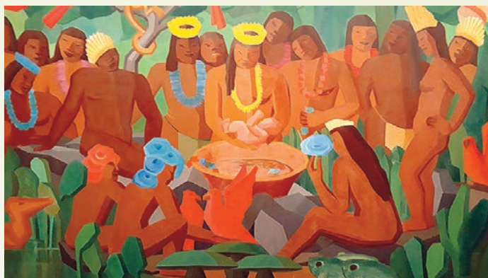
Imagem com modificações para o jogo "7 erros"