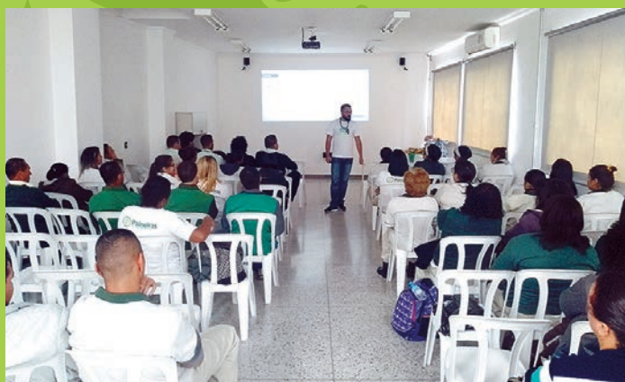
SEDE DA PAINEIRAS

No primeiro dia da SIPAT, 2 de setembro, as atividades ocorreram na Diretoria Regional de Educação – DRE Guaianases e na Biblioteca Prestes Maia, em Santo Amaro. No dia 3, ações foram promovidas no Centro Esportivo, Recreativo e Educativo do Trabalhador – CERET do Tatuapé e na sede da Fundação Hélio Augusto de Souza – FUNDHAS, em São José dos Campos. No dia 4, a SIPAT ocorreu no Sindicato dos Trabalhadores em Empresas de Prestação de Serviços de Asseio e Conservação e Limpeza Urbana de São Paulo – SIEMACO/SP e na DRE de São Matheus. No dia 5, mais ações atenderam a Delegacia da Polícia Federal – DPF da Lapa e a sede da Paineiras.