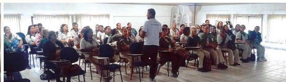
DRE SÃO MATHEUS