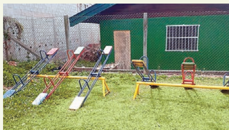
O playground foi totalmente reformado pela equipe da Paineiras