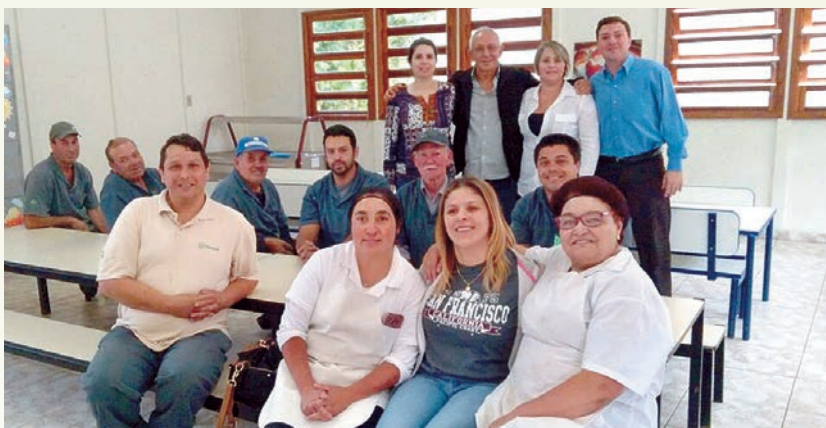
Colaboradores e clientes da Escola São Francisco de Assis

Recentemente, o grupo beneficiou as 127 crianças da escola municipal São Francisco de Assis, do bairro Vila Paulista Popular. Elas ganharam um playground totalmente reformado pela manutenção predial. O parquinho, como chamam as crianças de 3 a 5 anos de idade que estudam no local ficou novo em folha. O resultado final agradou as crianças, os clientes e os colaboradores da Paineiras.