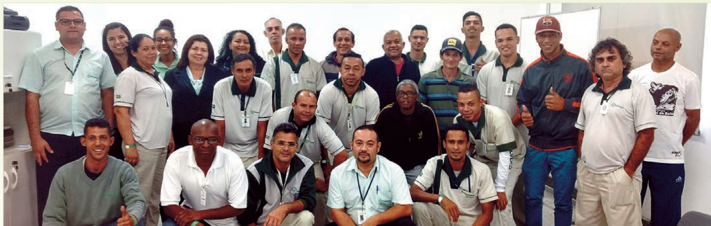
Turma do dia 16 de outubro

As atividades aconteceram nos dias 16 e 17 de outubro no centro de treinamento da sede da Paineiras, em Poá. Contando com a presença de supervisores, as equipes de limpadores tiveram a oportunidade de acompanhar diversas ações de atualização dos procedimentos