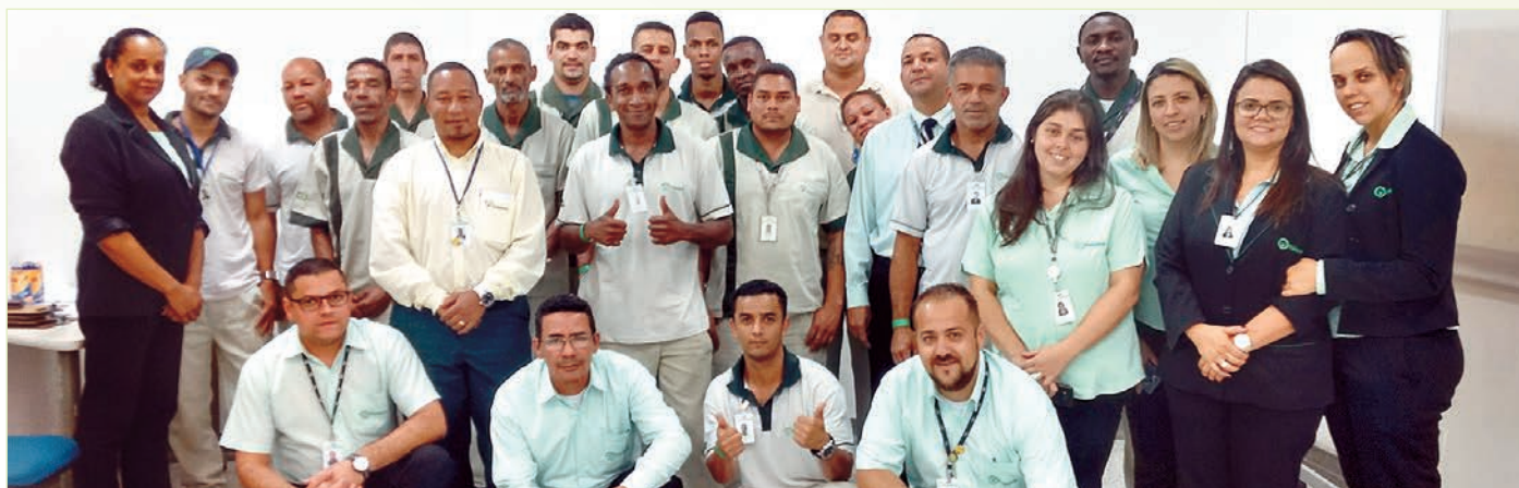
Turma do dia 17 de outubro

a satisfação dos clientes. Eles observaram, principalmente, que para atingir a excelência em suas funções é essencial o uso da técnica e a constante observação dos comportamentos adequados, bem como o cuidado com a segurança.