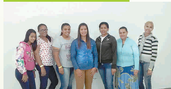
25 DE JANEIRO