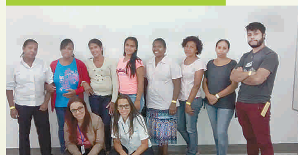
09 DE FEVEREIRO