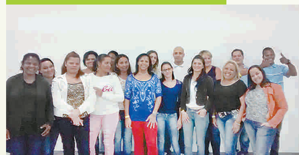
02 DE FEVEREIRO