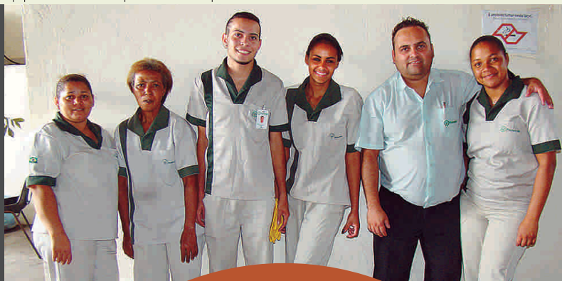
Equipe de colaboradores que trabalha na subprefeitura