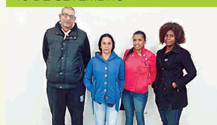
22 DE SETEMBRO