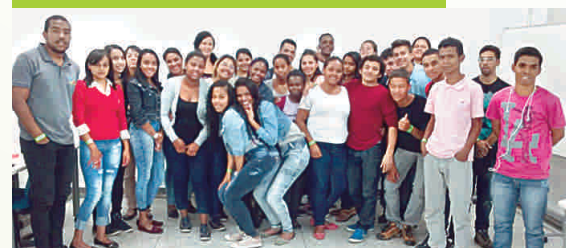
13 DE SETEMBRO