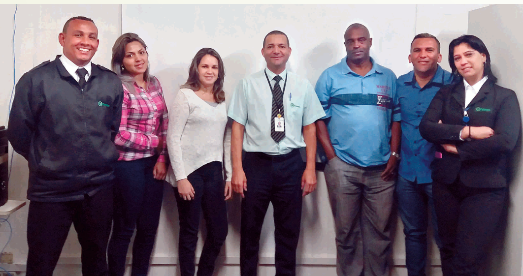
Colaboradores presentes no curso de portaria

empresa, como não utilizar aparelho celular durante o expediente de trabalho; e as técnicas de atendimento aos clientes internos e externos. Outro assunto que foi abordado no treinamento tratou da apresentação pessoal dos colaboradores que são responsáveis pela área de portaria do posto.