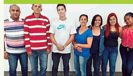
15 DE SETEMBRO