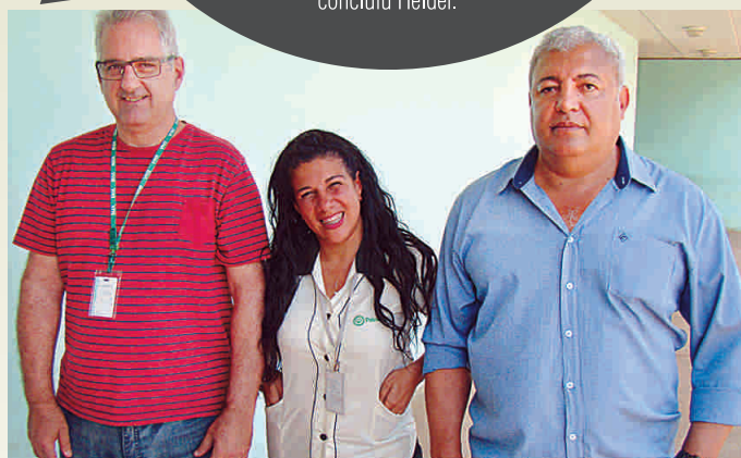
Clientes em companhia da encarregada da Paineiras