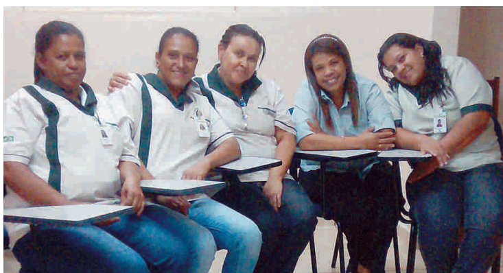
Equipe que participou do curso de capacitação em Ribeirão Preto