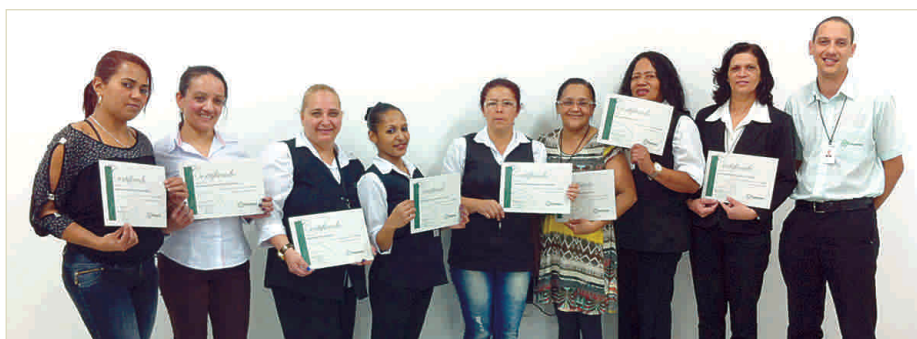
Copeiros que participaram do treinamento no dia 19 de agosto