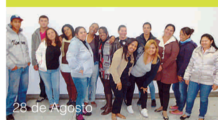
28 de Agosto