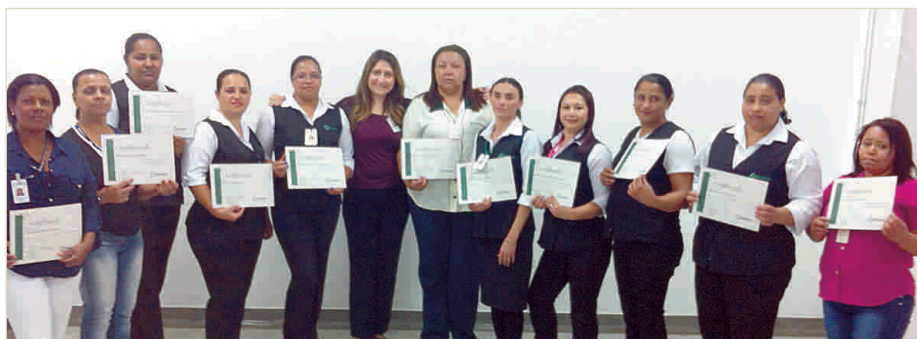
Copeiros que participaram do treinamento no dia 22 de agosto