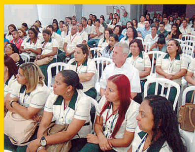
Sede da Paineiras em Poá