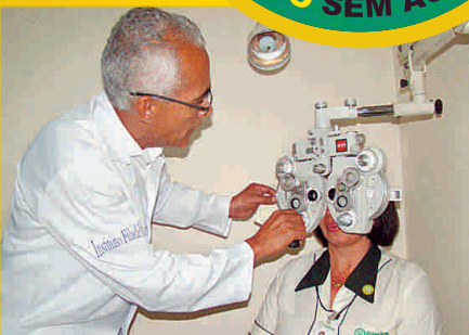
Exame de acuidade visual