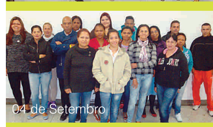
04 de Setembro