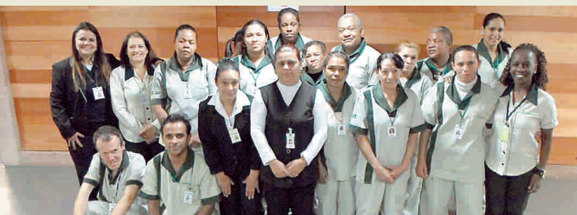
Equipe da Paineiras que atende a Praça das Artes

“Nosso pessoal responde de forma rápida a tudo que é solicitado. Trata-se de um grupo unido que atende bem as tarefas”