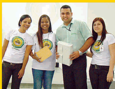
Sorteio de brindes