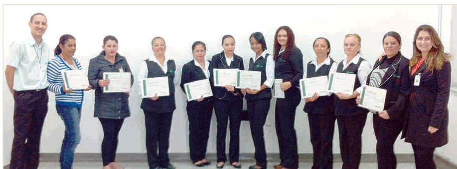
Copeiros que participaram do treinamento no dia 20 de agosto