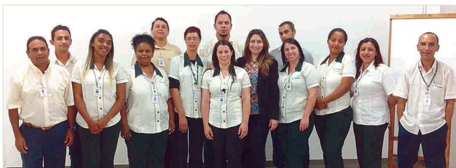
Turma da Educação Continuada

sobre Recursos Humanos e Comunicação. Já nos dias 19, 20 e 22 de Agosto aconteceu um curso de formação para copeiros, que tratou do tema “Boas Práticas de Copeiragem”. As atividades foram realizadas no centro de treinamento da Paineiras, em Poá, e contaram com atividades teóricas e práticas. Confira as fotos: