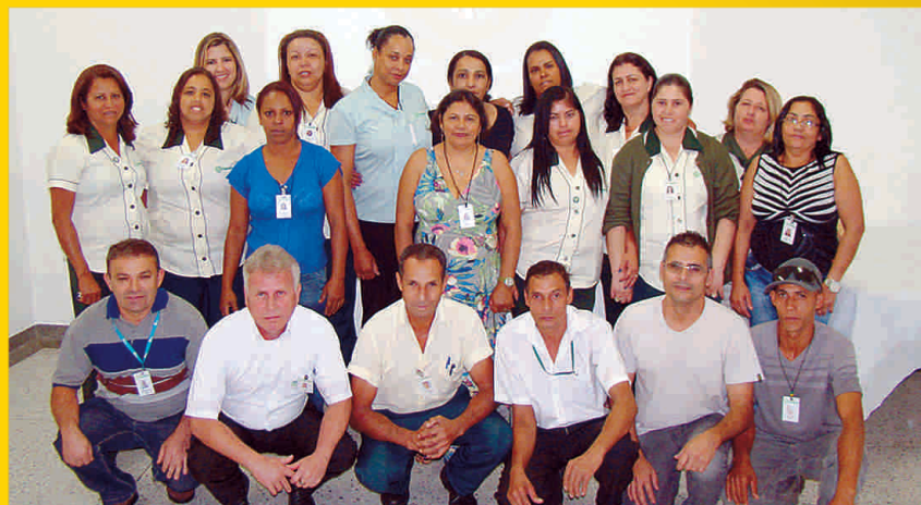
Posse dos novos integrantes da CIPA