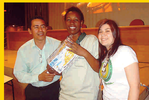
Fundação Hélio Augusto de Souza – FUNDHAS (São José dos Campos)