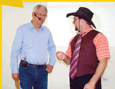
Apresentação teatral do grupo Sipatmania