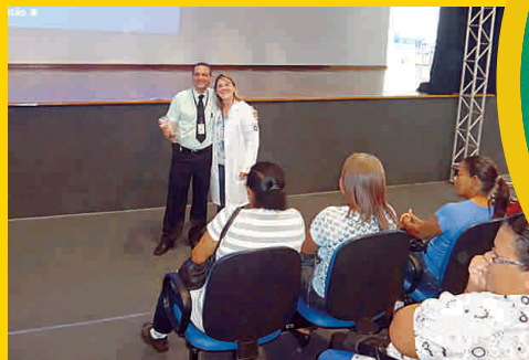
Secretaria Municipal de Habitação – SEHAB (São Paulo)