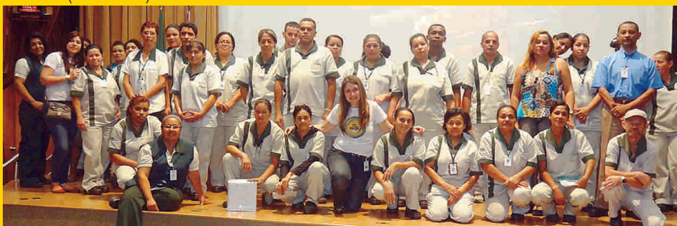
CETESB (São Paulo)