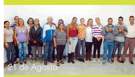
21 de Agosto