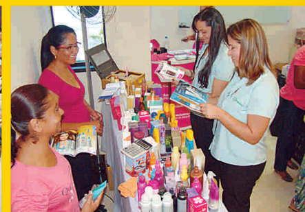
Exposição de cosméticos

A Semana de Prevenção de Acidentes no Trabalho deste ano ressaltou a necessidade de ampliar a segurança no trânsito e escolheu como tema principal “Tô na faixa: cidadão consciente, trânsito sem acidentes”. Porém, o evento organizado pelo SESMT - Serviço Especializado em Engenharia de Segurança e em Medicina do Trabalho – e pela CIPA – Comissão Interna de Prevenção de Acidentes – abordou também outros assuntos relevantes, como motivação pessoal, Aids e doenças sexualmente transmissíveis – DSTs. As atividades aconteceram entre 8 a 12 de setembro e atenderam postos da capital e do interior.