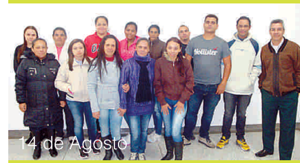
14 de Agosto