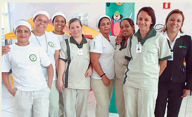
Profissionais da Paineiras que atendem a creche