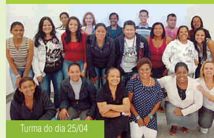
Turma do dia 25/04