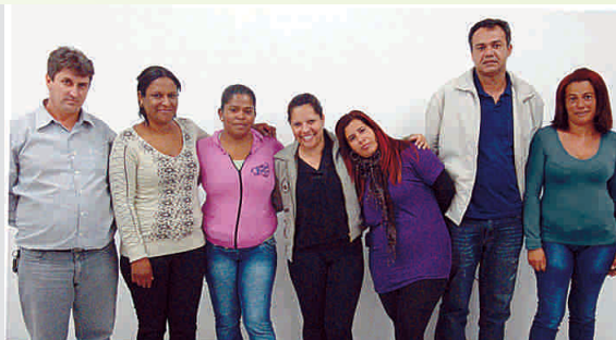
Turma do Módulo 1 do Programa de Educação Continuada

como ser sempre transparente, valorizar as opiniões alheias, não desistir, servir e representar a equipe, assumir as responsabilidades e saber lidar com as diferenças. O módulo I terá continuidade até o dia 4 de setembro e uma única turma será formada este ano. O Programa de Educação Continuada também capacitou os colaboradores da turma 2 do módulo II. As atividades aconteceram dia 14 de maio e o tema abordado foi a “Arte de Lidar com Pessoas” e “Administração de Contratos”.