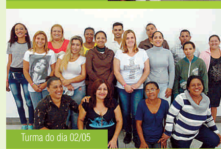
Turma do dia 02/05