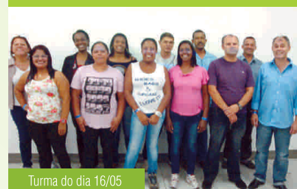
Turma do dia 16/05