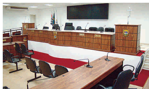
Plenário da Câmara