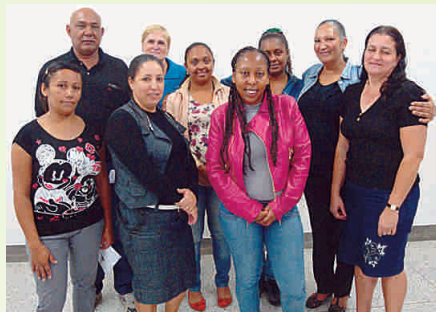
Turma 2 do Módulo 2 do Programa de Educação Continuada