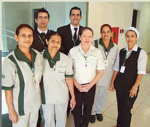
Profissionais que atuam na Câmara