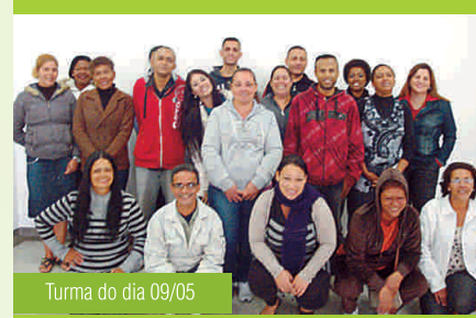
Turma do dia 09/05