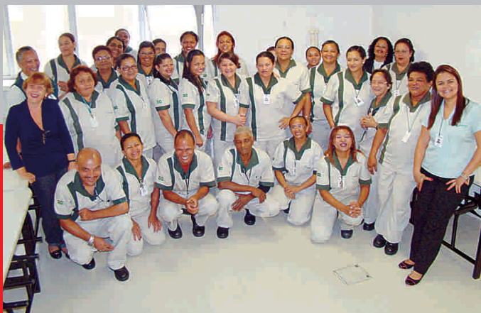
Equipe da Paineiras que atende a Secretaria Municipal de Finanças