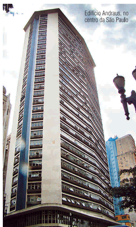
Edifício Andraus, no centro da São Paulo

Durante esse período, a Paineiras conta com a dedicação e empenho de uma equipe de profissionais treinada e que não mede esforços em atender às expectativas do cliente. Os bons resultados obtidos em mais de uma década de trabalho é fruto da união desse grupo.