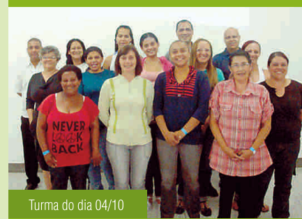
Turma do dia 04/10