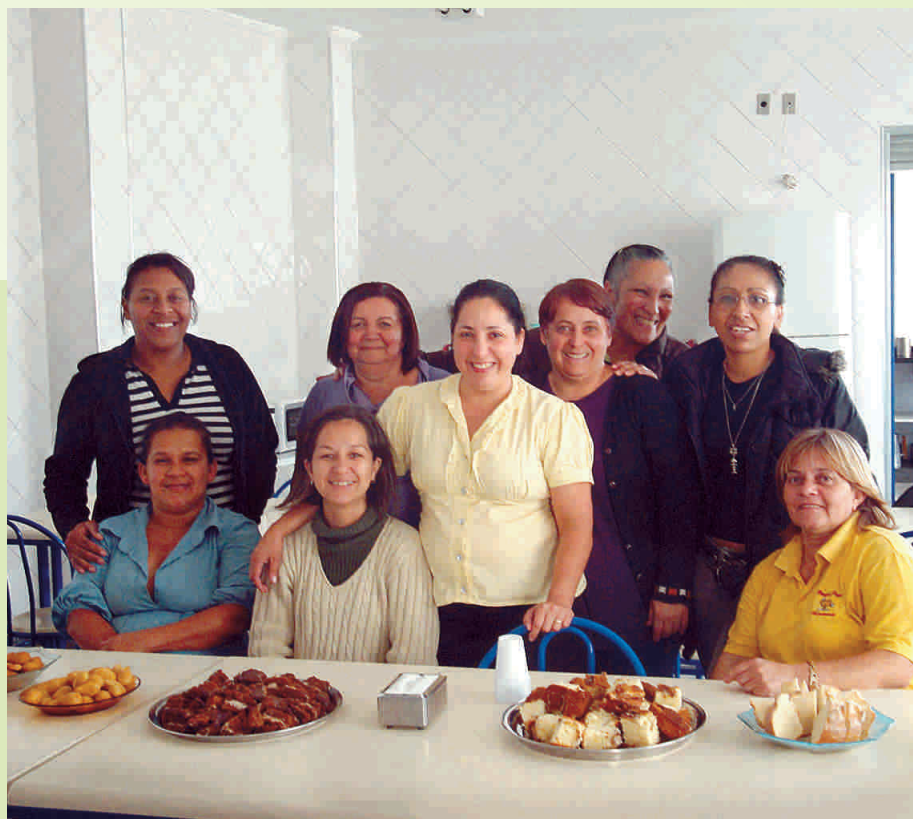
Confraternização da turma 3 do módulo 1

A turma 3 comemorou o final das atividades do módulo 1 do programa de Educação Continuada no dia 17 de outubro na sede da Paineiras, em Poá. As turmas 1 e 2 também completaram o mesmo módulo, mas nos dias 30 e 31 de outubro.