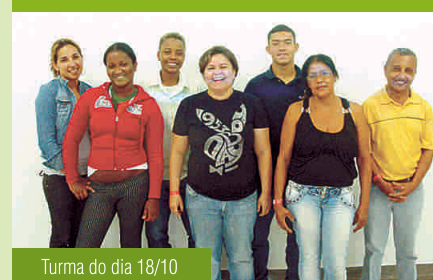
Turma do dia 18/10