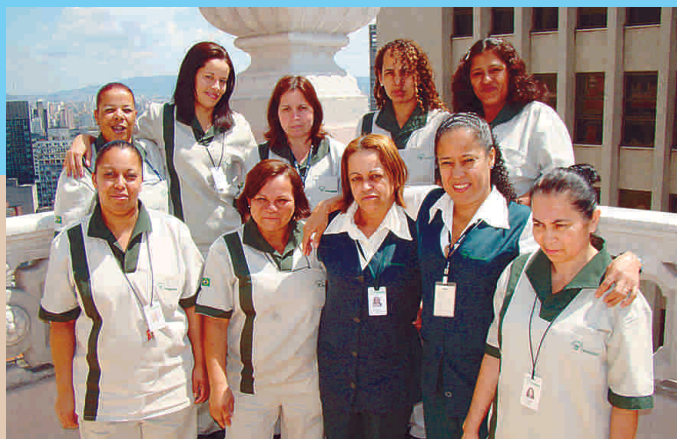
Colaboradores que atuam na sede da Cohab