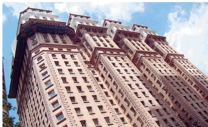
O Edifício Martinelli foi o primeiro a ser construído na América Latina. Inaugurado em 1929, o prédio tem 30 andares e fica na Rua São Bento, 405.