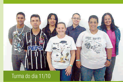
Turma do dia 11/10