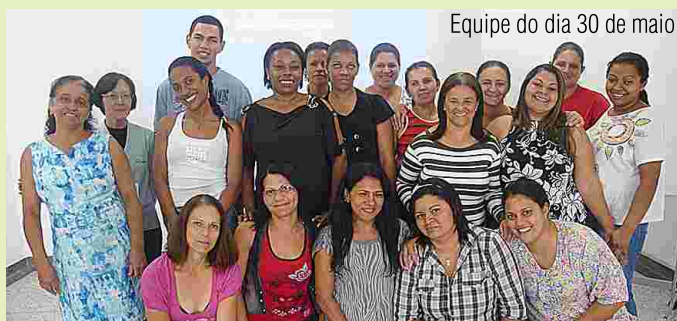
Equipe do dia 30 de maio

As atividades, desenvolvidas no centro de Treinamento da Paineiras aconteceram nos dias 30 de maio e 06 de junho. Nestas ocasiões, os profissionais que atendem o Hospital Municipal de Poá atualizaram seus conhecimentos e aprimoraram as técnicas de trabalho.