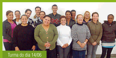
Turma do dia 14/06