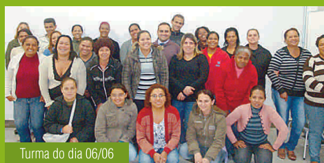
Turma do dia 06/06

Novos colaboradores, a Paineiras deseja a vocês boas-vindas e muito sucesso!