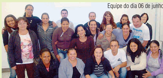
Equipe do dia 06 de junho