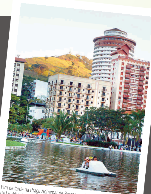
Fim de tarde na Praça Adhemar de Barros, região central de Águas de Lindóia. A praça, projetada pelo paisagista Burtle Marx, tem uma grande área verde ideal para passeios a pé ou de charretes.

Atenção: No e-mail, coloque seu nome e o posto onde você trabalha. Identifique também os locais e as cenas existentes nas fotos. As imagens digitais cedidas devem ter boa resolução.