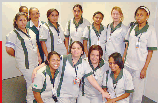
Profissionais da Paineiras que atuam na SIURB