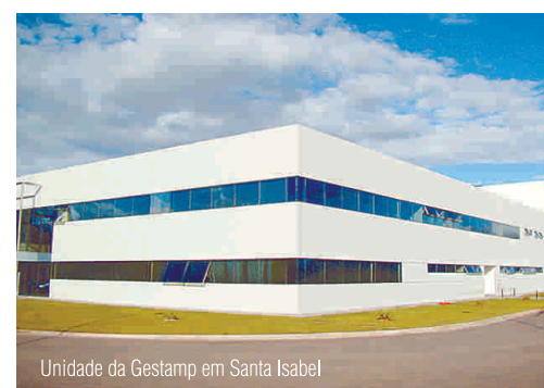
Unidade da Gestamp em Santa Isabel