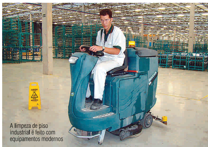
A limpeza de piso industrial é feito com equipamentos modernos