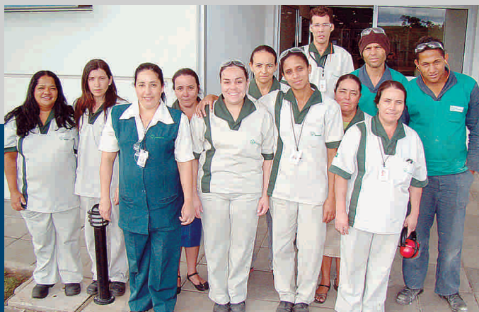
Profissionais da Paineiras que atuam na multinacional espanhola