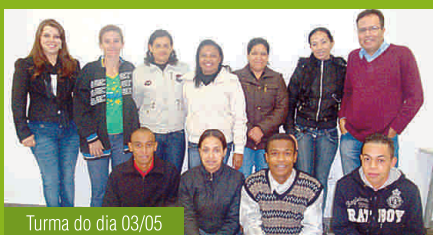
Turma do dia 03/05