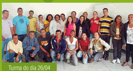
Turma do dia 26/04

Novos colaboradores, a Paineiras deseja a vocês boas-vindas e muito sucesso!