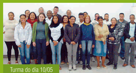
Turma do dia 10/05