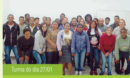
Turma do dia 27/01