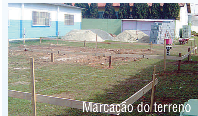
Marcação do terreno