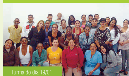
Turma do dia 19/01

Novos colaboradores, a Paineiras deseja a vocês boas-vindas e muito sucesso!