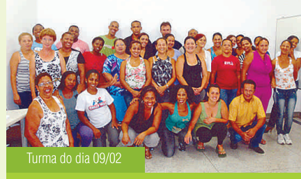
Turma do dia 09/02