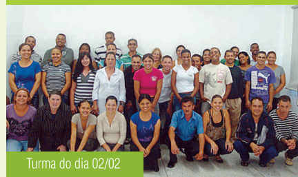
Turma do dia 02/02