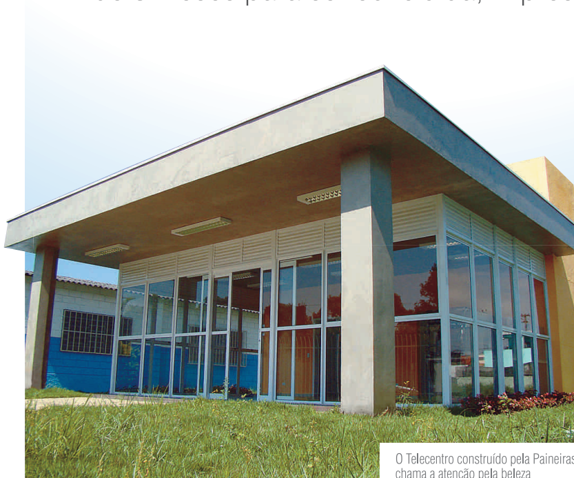
O Telecentro construído pela Paineiras chama a atenção pela beleza

Preocupada em oferecer o melhor serviço em todos os ramos em que atua, a Paineiras ganhou novamente evidência ao construir e entregar à prefeitura da cidade de Poá o prédio do telecentro da Vila Jaú. A obra, que durou cerca de 3 meses para ser concluída, impressiona quem passa pelo local.