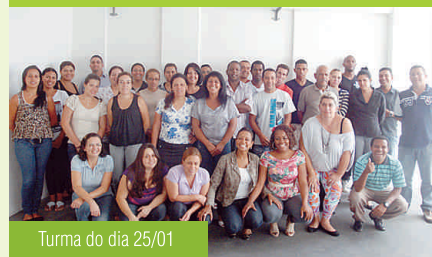
Turma do dia 25/01